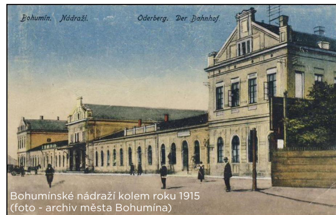
Bohumínské nádraží kolem roku 1915

Právě na nástupišti místní železniční stanice rozehrála známá hluchínská spisovatelka Eva Tvrdá jednu z nejvypjatějších scén své úspěšné historické novely Dědictví. Ale věřte, že podobně krutých a dojemných scén zažila tahle krásná železniční budova v průběhu 19. a 20. století celou řadu. V prosinci roku 1923 zde tak např. dohasínal mladý život jednoho z nejvýznamnějších českých básníků 20. století. Víte, o koho šlo?