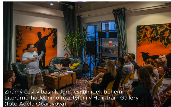
Známy český básník Jan Těšpohlídek během Literárně-hudebního rozptýlení v Hair Train Gallery

Galerie kromě pravidelných vernisáží organizuje i autorská čtení, tzv. Literárně-hudební rozptýlení, na nichž se pravidelně objevují uznávaní mladí spisovatelé ze všech končin naší země.